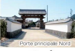
Porte principale Nord