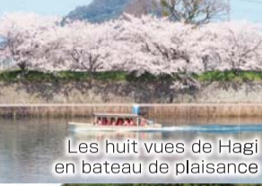
Les huit vues de Hagi en bateau de plaisance