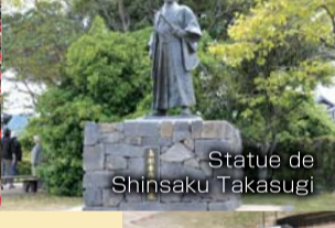
Statue de Shinsaku Takasugi