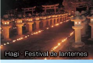
Hagi · Festival de lanternes