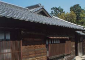
Ancienne demeure Yukawa