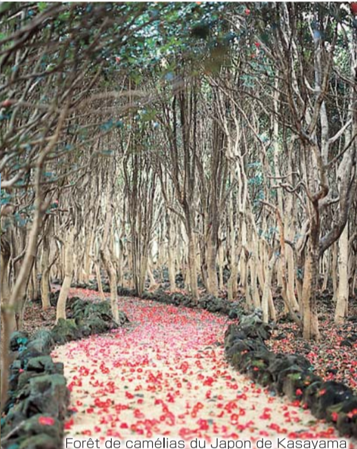
Forêt de camélias du Japon de Kasayama