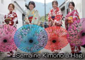
Semaine Kimono à Hagi