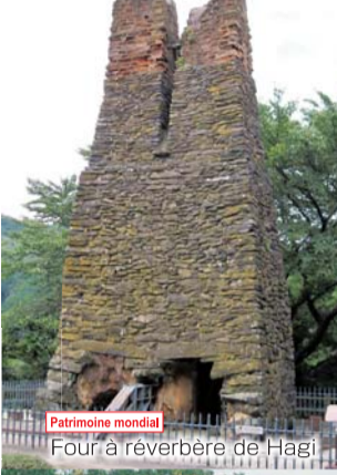
Patrimoine mondial Four à réverbère de Hagi