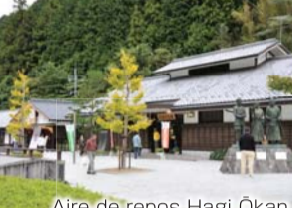
Aire de repos Hagi Ōkan