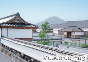
Musée de Hagi