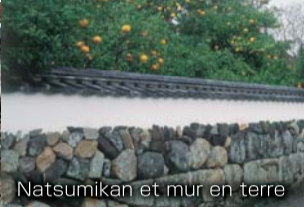
Natsumikan et mur en terre