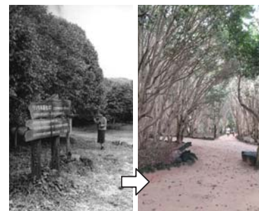
昭和52年/1977年から現在の椿群生林の様子