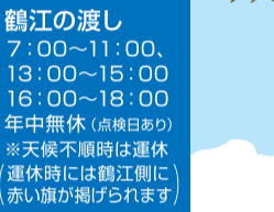
鶴江の渡し 7:00～11:00、 13:00～15:00、 16:00～18:00 年中無休(最終日のみ) *天候不順時は運休 運休時には鶴江側に 赤い旗が掲げられます

萩沖約45kmの日本海に浮かぶ離島。釣りやダイビング、バードウォッチングのスポットとして人気があります。新鮮な海の幸も魅力! アクセス/萩海港より高速船「ゆりや」で約70分