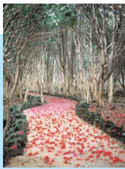
笠山椿群生林 (見頃 2月中旬～3月下旬)