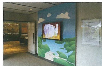
須佐地域の成り立ちと特徴を簡単な説明と映像と音楽でご紹介します。