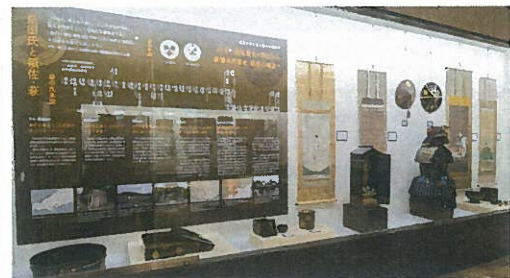
江戸時代、須佐を本拠に一万二千余石を領有し、萩藩永代家老として毛利氏を最後まで支え、「萩の土堀は須佐(功)で持つ」といわれた益田氏。その歴史を紹介します。