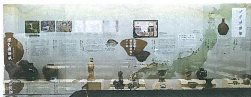
「青磁釉」の須佐唐津焼の特徴と、北前船によって全国各地に分布していた須佐唐津焼のすり鉢について紹介と残っている優れた須佐唐津焼の展示をしています。