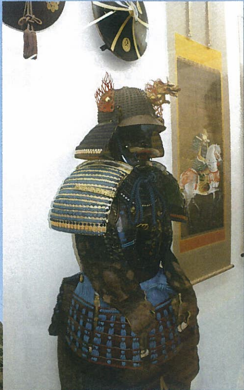
▲益田氏と須佐コーナー