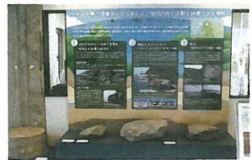
ジオパークとは、地域の自然に親しみ、その成り立ちを学び、楽しむ場所です。須佐地域のジオパークのみどころ(ジオサイト)を紹介します。

須佐唐津焼と萩焼の歴史と、それぞれの特徴、須佐唐津焼ができるまでの説明、制作道具などを展示しています。また、須佐唐津焼と萩焼の違いを触って確かめる体験コーナーも設置しています。