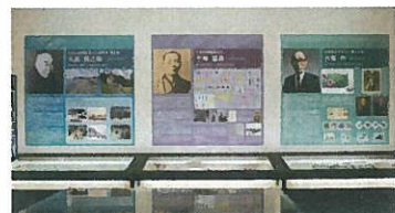
須佐出身の先人たちの中から「日本の近代を支えた実業家・政治家久原 房之助」、「日本の時刻表の父 手塚 猛昌」、「日本切手デザイン界の大家 大塚 均」をご紹介します。