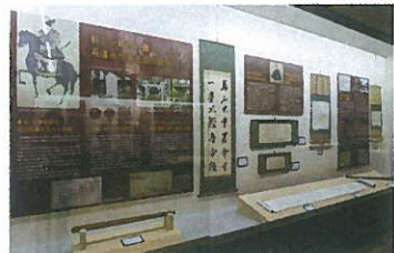
新しい時代の礎となった萩藩永代家老 益田親施について、萩の松下村塾と須佐育英館の交流、「回天軍」や「四境戦争」など、幕長戦争のエピソードをご紹介します。