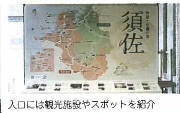
入口には観光施設やスポットを紹介