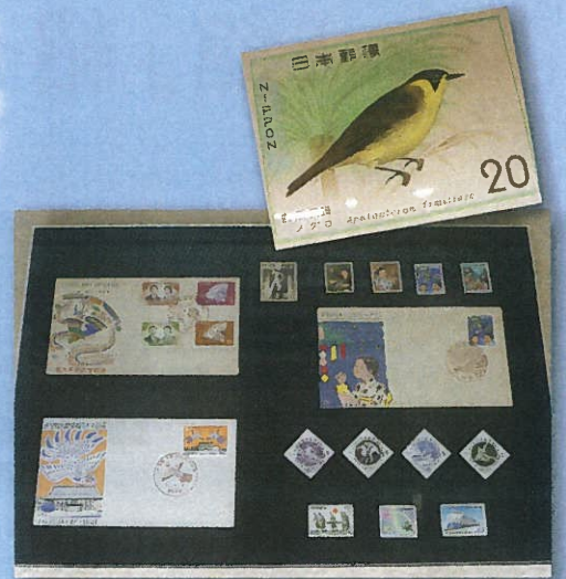
▲▼日本の近代化を支えた郷土出身者コーナー