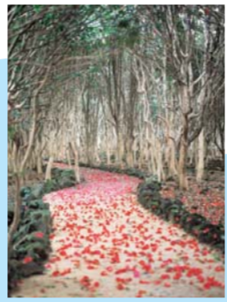
笠山椿群生林 (見頃2月中旬～3月下旬)