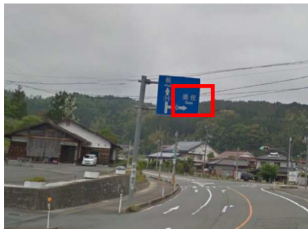
①道の駅「ハピネスふくえ」を左折し、須佐方面へ信号を右折