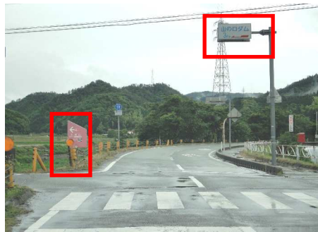
②山ノロダム方面へ左折 ※山ノロダム3kmの看板とピンク色の大板山たたら製鉄遺跡看板が目印 ※ここから先、大型バスは通行不可