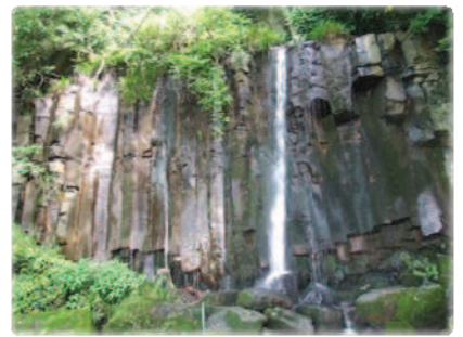
普段は水量が少ないけど...