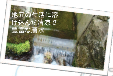
地元の生活に溶け込んだ清涼で豊富な湧水