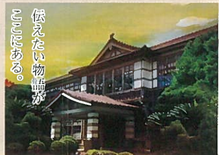
懐かしい物語が あふれる。