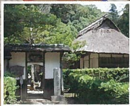
花江茶亭・梨羽家茶室