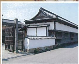
旧厚狭毛利家萩屋敷長屋

前売券/セット券(薄茶四席) 2,000円 セット券(薄茶二席) 1,100円 当日券/一席券 600円