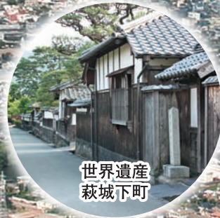
世界遺産 萩城下町