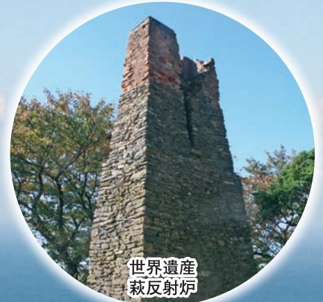
世界遺産 萩反射炉