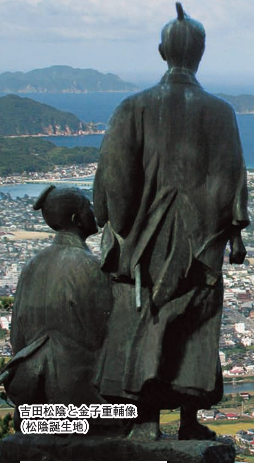
吉田松陰と金子重輔像 (松陰誕生地)

平成27年7月に世界遺産に登録された松下村塾や萩城下町、萩反射炉など市内主要観光地を巡る定期観光バスを運行します (地元観光ボランティアガイド同行)。ぜひご利用ください。