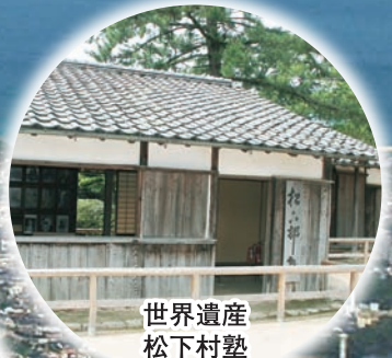
世界遺産 松下村塾