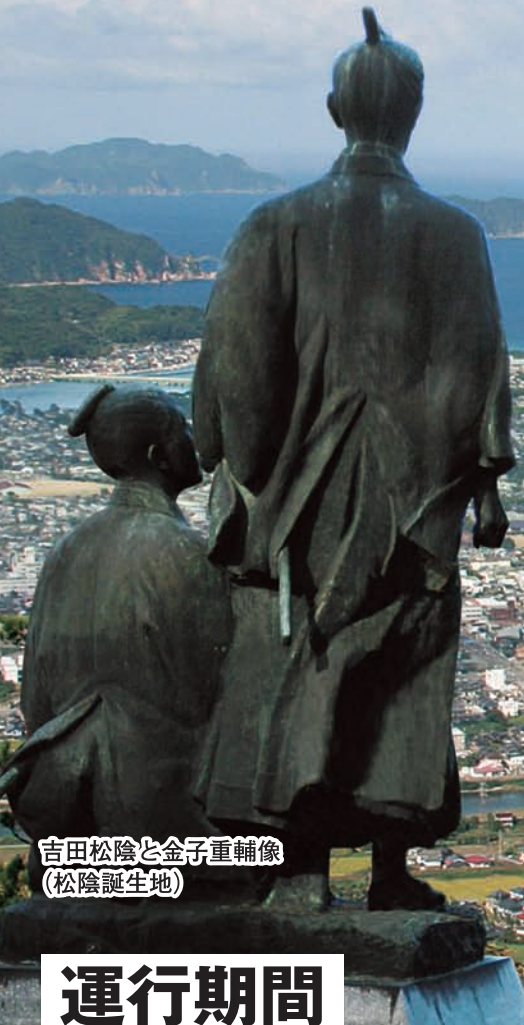
吉田松陰と金子重輔像 (松陰誕生地)

平成27年7月に世界遺産に登録された松下村塾や萩城下町、萩反射炉など市内主要観光地を巡る定期観光バスを運行します(地元観光ボランティアガイド同行)。ぜひご利用ください。