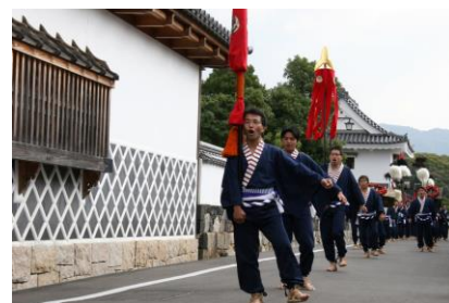
※写真はイメージです （平安古大名行列のもの）